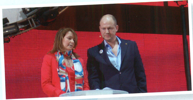
Voor het eerst op het podium voor 10.000 mensen!