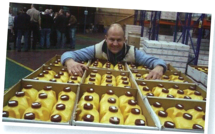
Bij de fabriek in Amerika

Realiseer je dat ook jij buitengewone dingen kunt bereiken in je leven. Sluit je ogen en stel jezelf voor in de toekomst, wat voor leven wil je, beleef dit leven, open daarna je ogen weer en voel de energie die in je opstijgt. Deze energie is dagelijks nodig en zet aan tot actie. Als je niets verandert aan je manier van denken en handelen, dan leef je over vijf jaar nog steeds hetzelfde leven. Neem de tijd om te begrijpen hoe netwerkmarketing werkt. En wees niet bang voor verandering, het is geen totale omwenteling maar een mooie ontwikkeling." 🦋